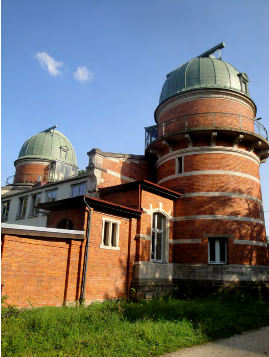
Abbildung 0.1: Kuppeln der Dr. Karl Remeis-Sternwarte Bamberg