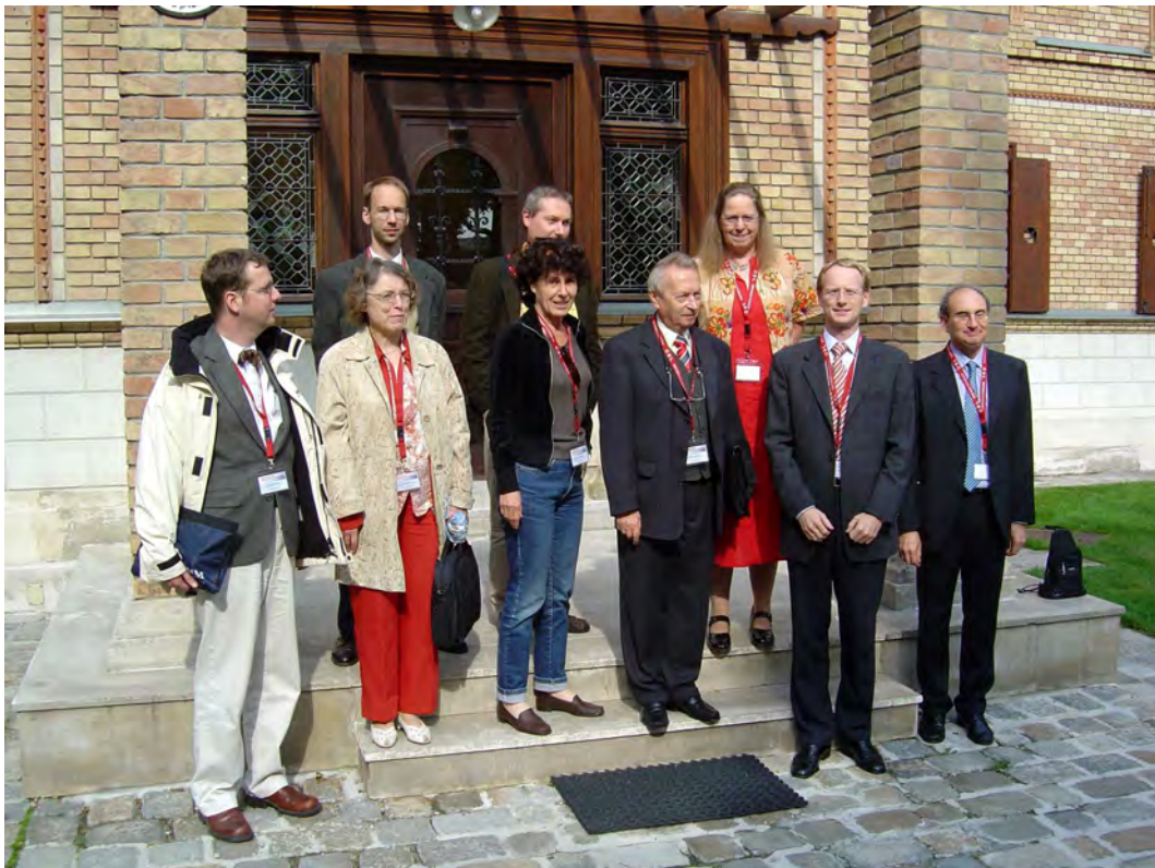
Abbildung 0.2: Vortragende der Tagung in der Kuffner-Sternwarte in Wien, 7.–9. Oktober 2004