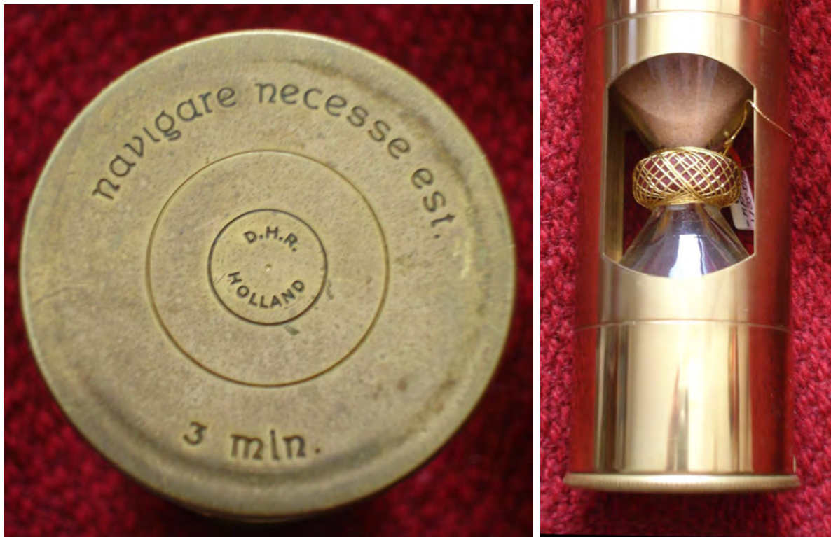
Abbildung 0.2: Logsanduhr (3min) – „Navigare necesse est“